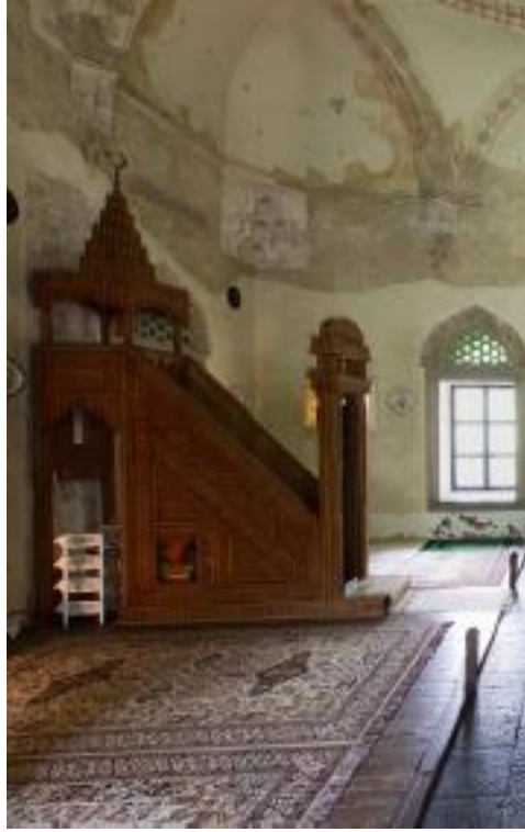
لوحة (٥) منبر حديث لمسجد ياكوفالي حسن باشا ببيتش