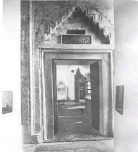
لوحة (٢) مدخل مسجد ياكوفالي حسن باشا ببيتش