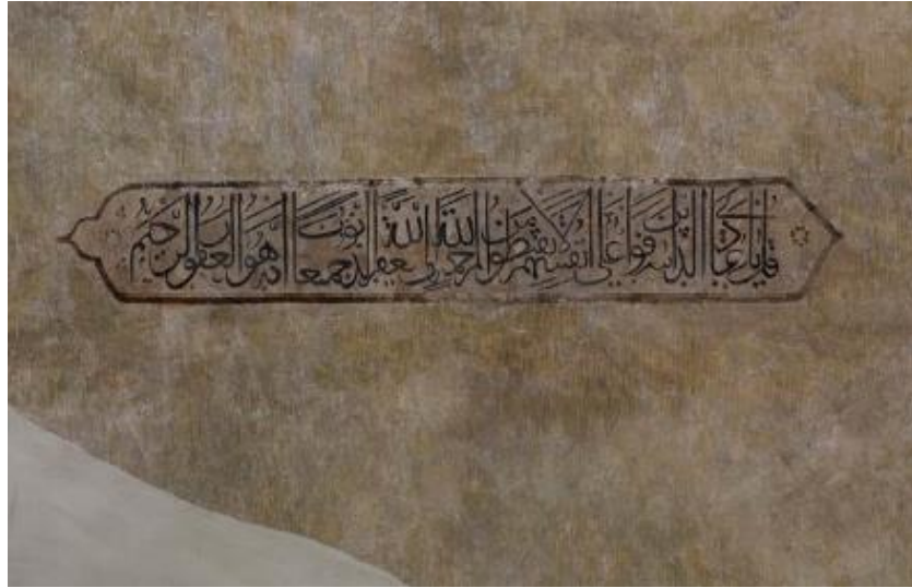
لوحة (٦) الكتابات القرآنية على حوائط مسجد ياكوفالي حسن باشا ببيتش بالمجر