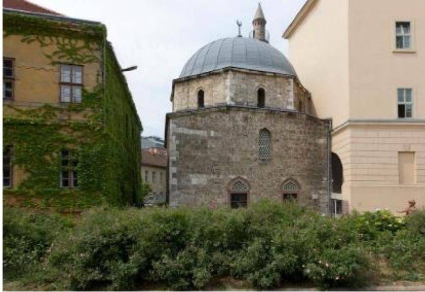
لوحة (١) مسجد ياكوفالي حسن باشا بمدينة بيتش بالمجر