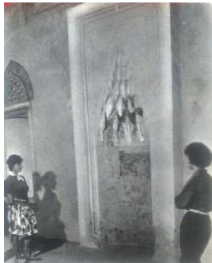
لوحة (٤) محراب مسجد ياكوفالي حسن باشا بمدينة بيتش