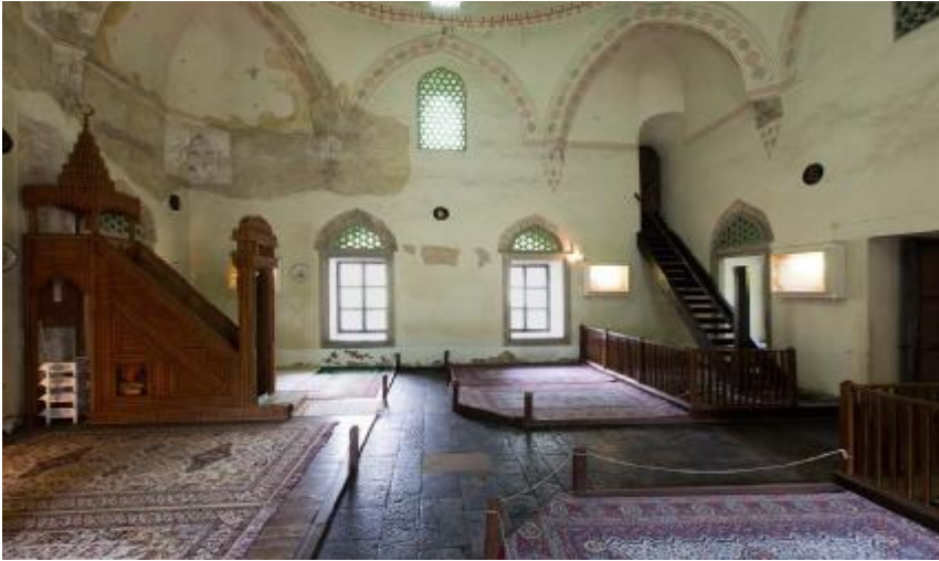
لوحة (٣) مسجد ياكوفالي حسن باشا من الداخل