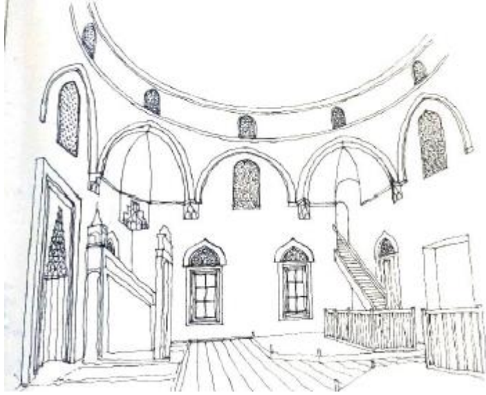
شكل (٣) قطاع راسي لمسجد ياكوفالي حسن باشا بيتش من الداخل